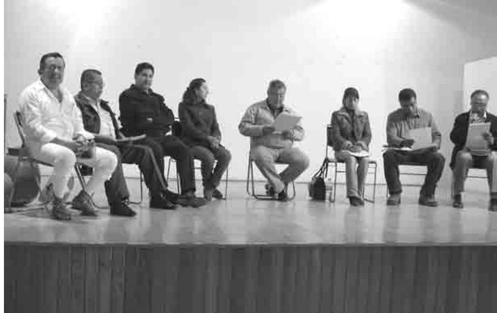
Aprobación en Cabildo abierto.

Lo que se entrega es como un plan de trabajo que lleva el nombre de Programa de Ordenamiento, se definen metas a corto mediano y largo plazo, se definen actores para