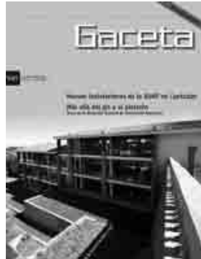
Portada: Campus Regional Cuetzalan de la BUAP.