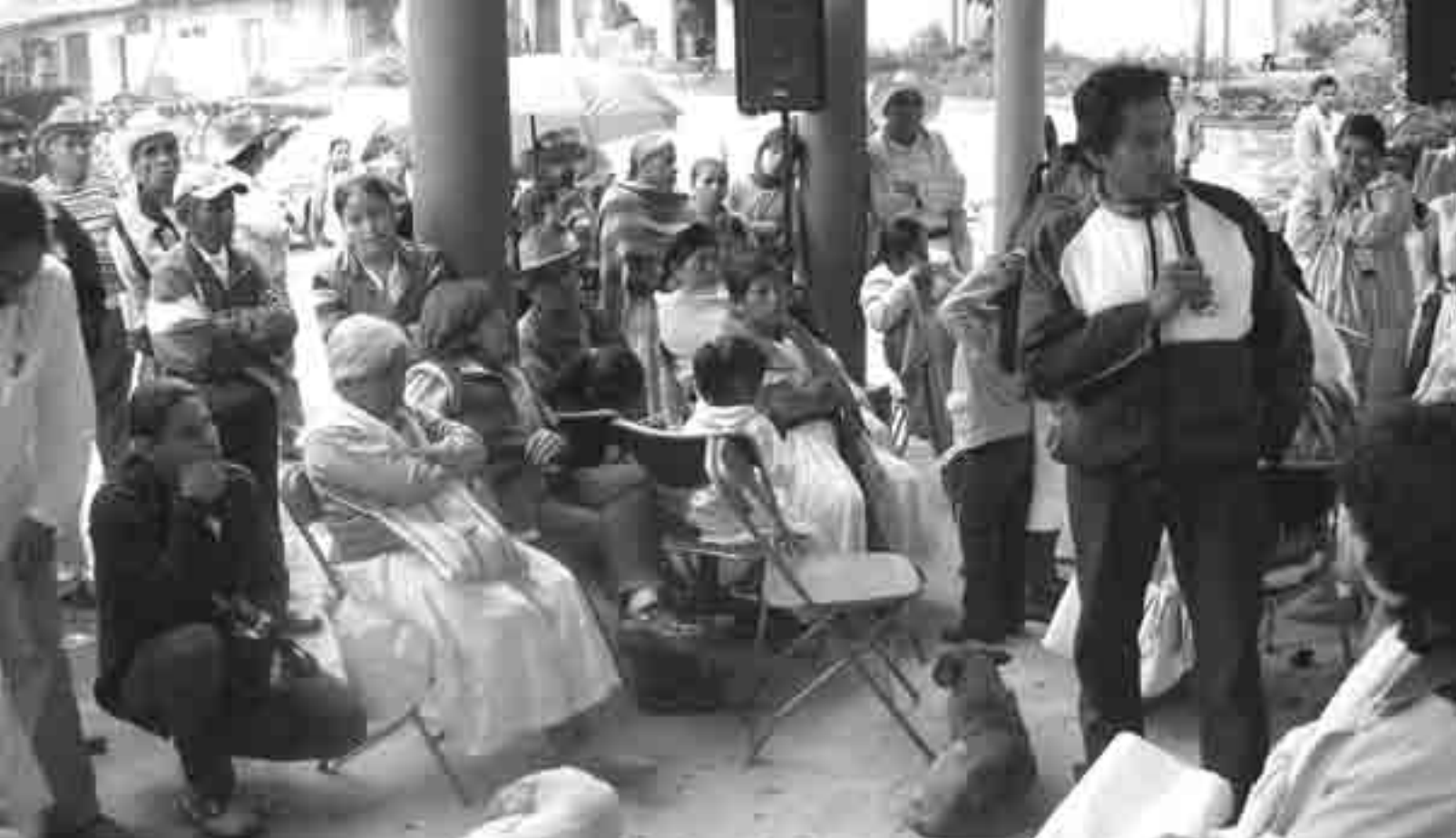
Taller en Zacatipan.

Cuetzalan; es una obra de organización y política pública que les servirá para presentar proyectos a nivel federal y estatal, para resolver discrepancias dentro del municipio.