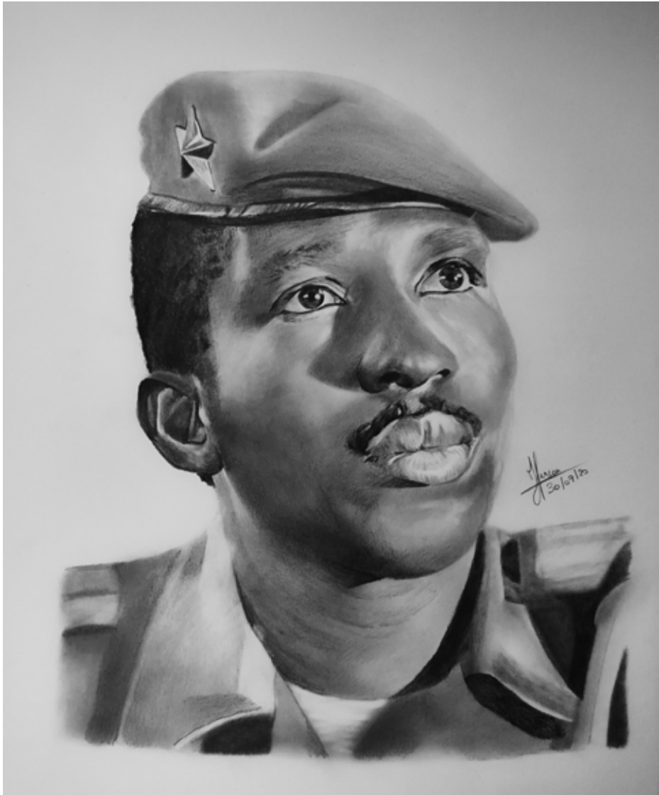
Thomas Sankara,* Burkina Faso