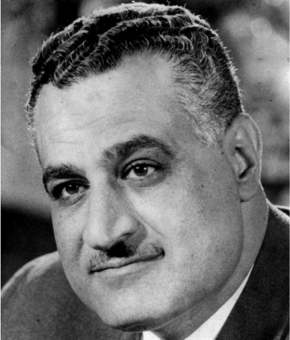
Gamal Abdel Nasser,* Egipto

* Portrait of Gamal Abdel Nasser during his second term. Photo taken in Egypt, 1968. Disponible en: https://commons.wikimedia.org/wiki/File:Nasser_portrait2.jpg