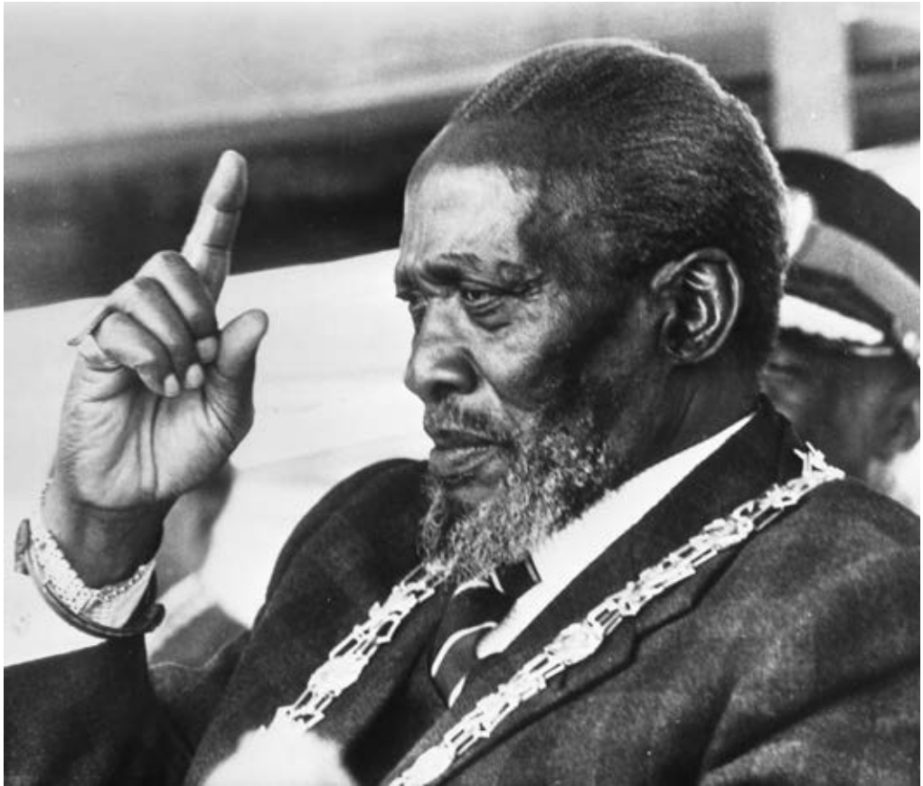
Jomo Kenyatta,* Kenia

* Jomo Kenyatta , 22 de agosto de 1978.