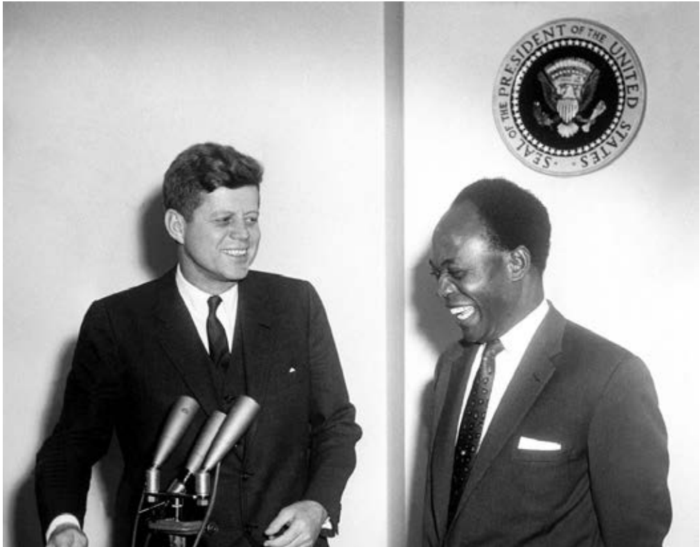
Visita oficial de Nkrumah a Estados Unidos de América, con el entonces presidente John F. Kennedy (8 de marzo de 1961). 43