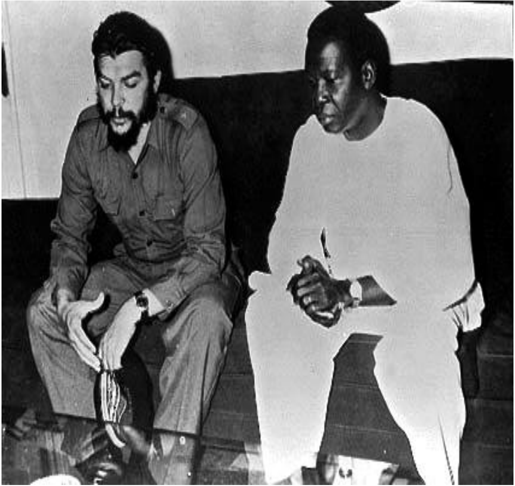
Ernesto Che Guevara y Nkrumah (enero de 1965) 42

42 Enzo Cursio (6 de mayo de 2014). Ernesto Che Guevara visitó Ghana en la tercera semana de enero de 1965. Con la noticia de su inminente visita, Nkrumah llamó al embajador Entralgo, expresando su emoción por la visita y demandando que El Che se quedara en Ghana unos días más para interactuar con más gente. El Che se encontró con Nkrumah en su segundo día de visita: un gesto desde la Cuba de Fidel, solo que esta vez con un hombre que se convertiría en un símbolo universal de la lucha por la independencia íntegra y del socialismo en los países del tercer mundo. Este era un acontecimiento raro de internacionalismo, heroísmo, desapego del ego y sacrificio por el bienestar del pueblo. La delegación del Che llegó más tarde, la noche del 14 de enero, pero sostuvo discusiones hasta el día si-