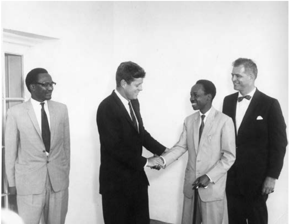
Julius Nyerere, en reunión con el presidente de los Estados Unidos, John F. Kennedy, el 17 de julio de 1961. 31