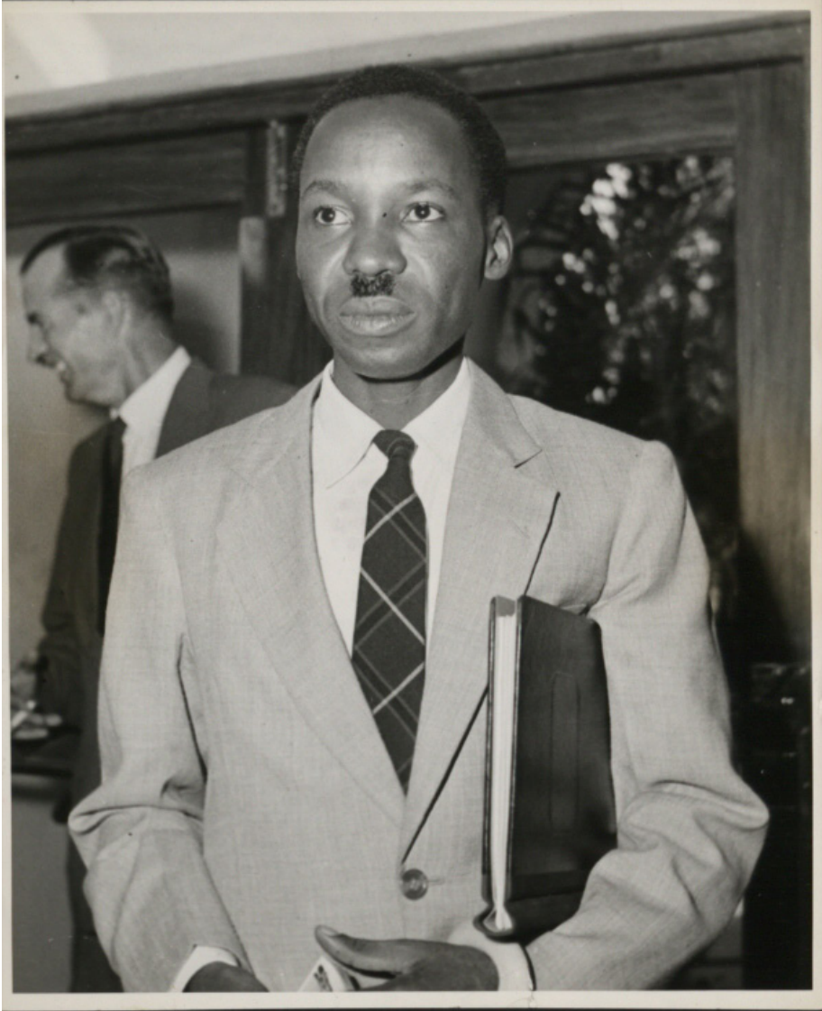
Julius Kambarage Nyerere,* Tanzania

* UK National Archives, Julius Nyerere as leader of the Legislative Council of Tanganyika , 1960. Disponible en: https://www.flickr.com/photos/nationalarchives/5404725611/in/set-72157625849884949/