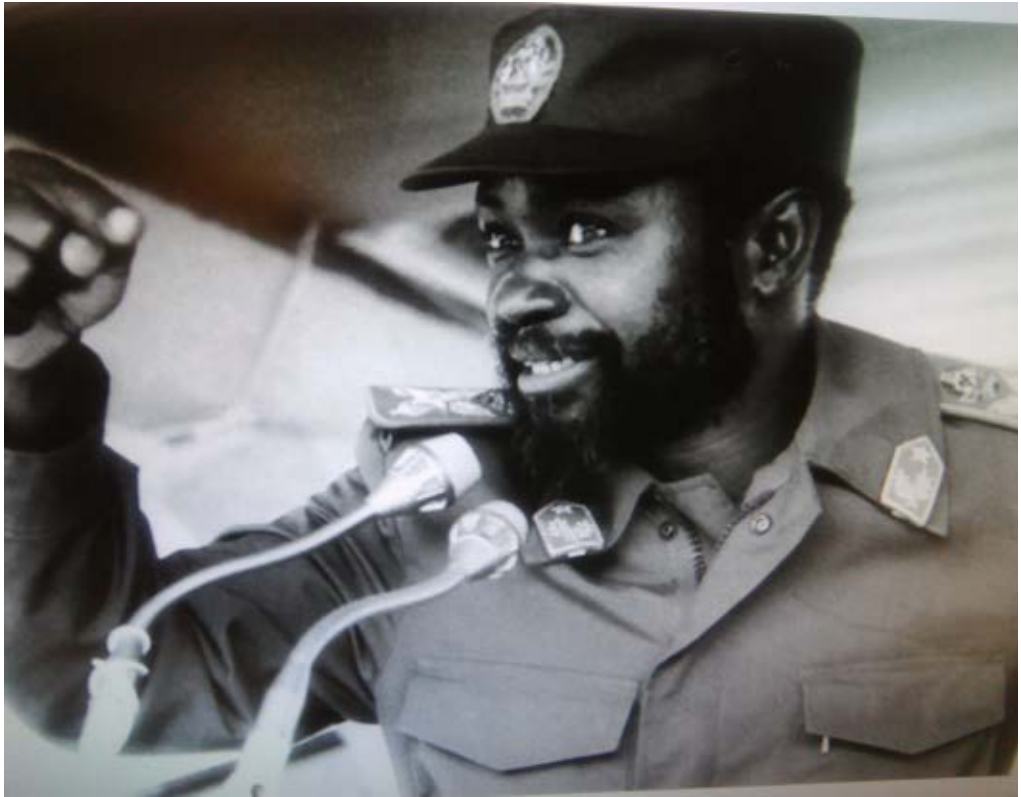
Samora Moisés Machel,* Mozambique

* Justice Nyathi, Samora Machel Photo , 30 de octubre de 2018. Disponible en: https://commons.wikimedia.org/wiki/File:Samora_Machel_Photo-_invent-the-future.org.jpg