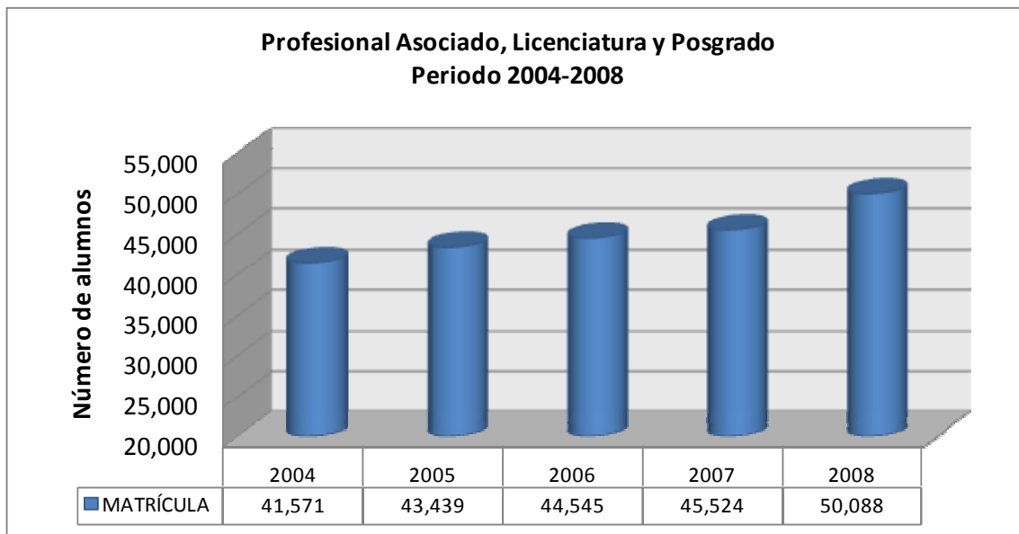
Gráfica 1. Evolución de la matrícula de nivel superior en la BUAP